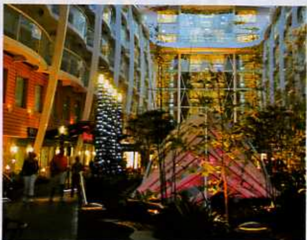
SOSSEGO E AGITO Sobram cantinhos escondidos para curtir a dois. Ao lado, o movimento do Central Park