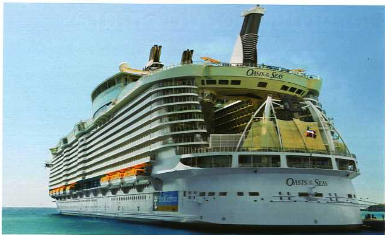
CIDADE FLUTUANTE A estrutura inovadora do Oasis, com um vão no centro do navio, tornou possível mais áreas ao ar livre; abaixo, a Royal Promenade, com oito lojas e nove restaurantes, é iluminada com energia solar