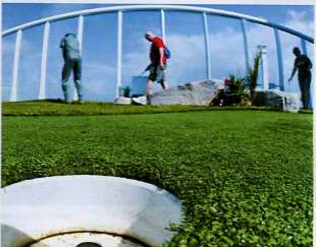
TAMANHO FAMÍLIA O carrossel diverte as crianças na Boardwalk. Ao lado, adultos jogam no minicampo de golfe