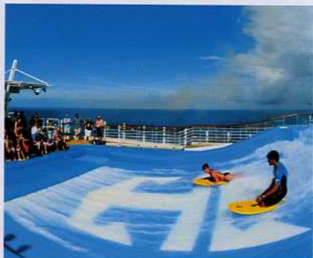
APRENDENDO A JOGAR A diversão não para no elegante Casino Royale. Ao lado, o simulador de surfe FlowRider